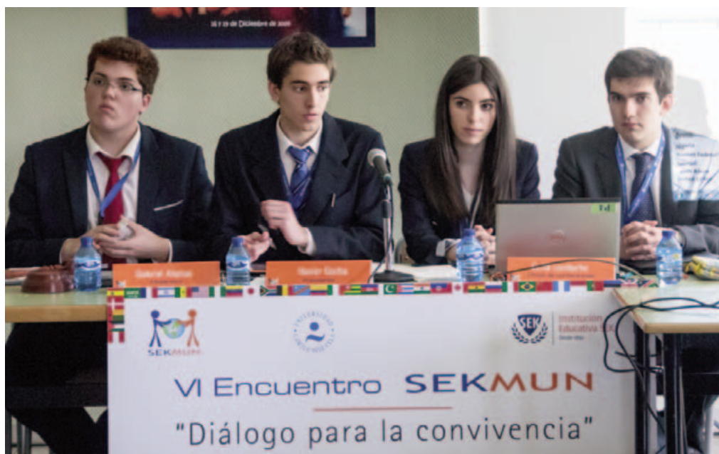
VI Encuentro SEKMUN. Consejo de Derechos Humanos.